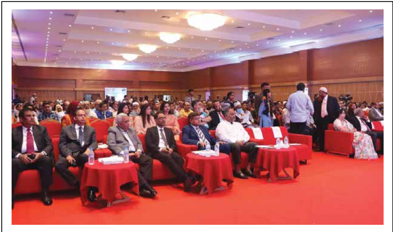
কনফারেন্সে অংশগ্রহণকারী অতিথিবৃন্দ।