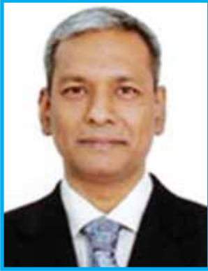
ড. শেখ শামসুদ্দিন আহমেদ কমিশনার