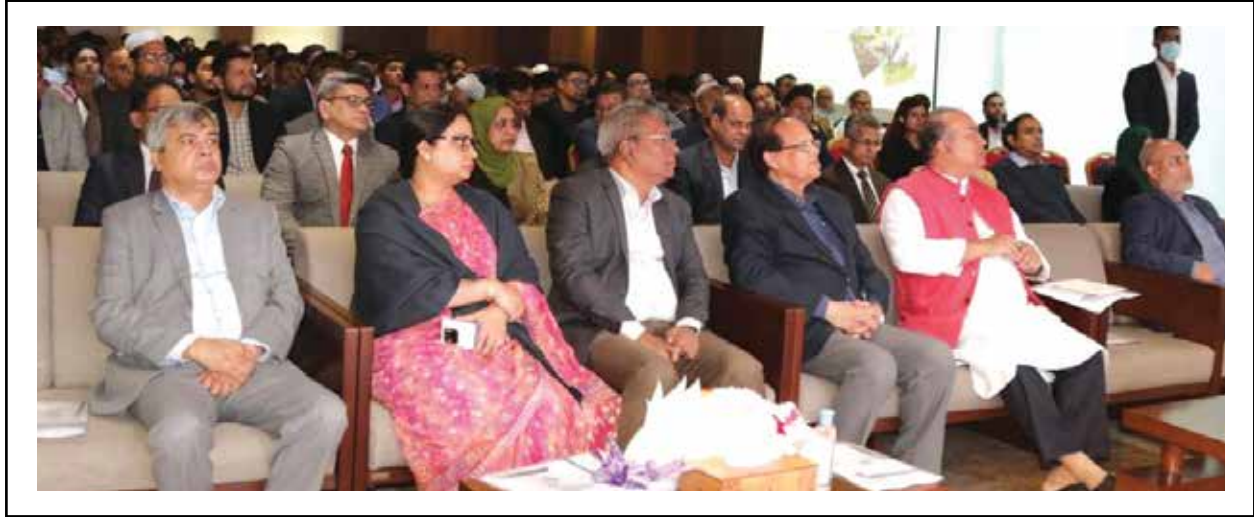
সেমিনারে অংশগ্রহণকারী অতিথিবৃন্দ ও কমিশনের কর্মকর্তা-কর্মচারীবৃন্দ।