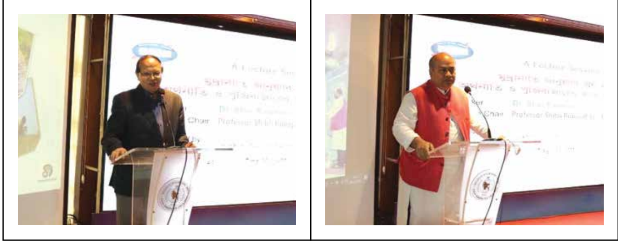
সেমিনারে মূল্যবান বক্তব্য প্রদান করছেন বাংলাদেশ ব্যাংকের সাবেক গভর্নর ও অর্থনীতিবিদ ড. আতিউর রহমান এবং বিএসইসি'র চেয়ারম্যান অধ্যাপক শিবলী বুবাইয়াত-উল-ইসলাম।

‘মুদ্রানীতি জানুয়ারি-জুন ২০২৩: অর্থনীতি ও পুঁজিবাজারের ওপর সম্ভাব্য প্রভাব’ শীর্ষক সেমিনার গত ৩০ জানুয়ারি, ২০২৩ তারিখে বিএসইসিতে অনুষ্ঠিত হয়েছে।