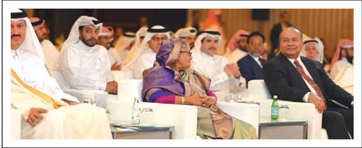
ইনভেস্টমেন্ট সামিট -এ উপস্থিত গণপ্রজাতন্ত্রী বাংলাদেশ সরকারের মাননীয় প্রধানমন্ত্রী শেখ হাসিনা ও অন্যান্য অতিথিবৃন্দ।

বাংলাদেশ সিকিউরিটিজ অ্যান্ড এক্সচেঞ্জ কমিশন (বিএসইসি) এবং বাংলাদেশ ইনভেস্টমেন্ট ডেভেলপমেন্ট অথোরিটি (বিডা), পররাষ্ট্র মন্ত্রণালয় এবং ‘বাংলাদেশ ফোরাম কাতার’-এর পারস্পরিক সহযোগিতায় গত ০৬ মার্চ, ২০২৩ তারিখে কাতারে ‘দ্য রাইজ অব বেঙ্গল টাইগার: পটেনশিয়াল অব ট্রেড অ্যান্ড ইনভেস্টমেন্ট ইন বাংলাদেশ’ শীর্ষক ইনভেস্টমেন্ট সামিট উদ্বোধন করা হয়েছে।