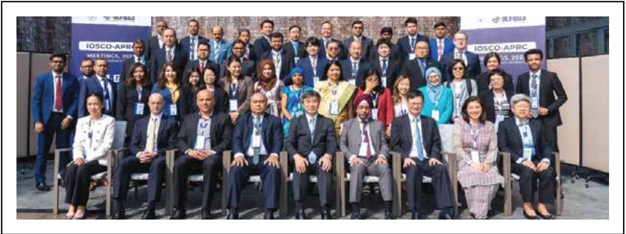
দ্বিতীয় দিনের সভায় উপস্থিত অতিথিবৃন্দ।