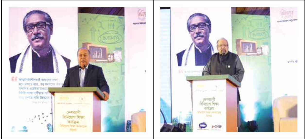
কনফারেন্স -এ বক্তব্য রাখছেন বিএসইসি'র চেয়ারম্যান অধ্যাপক শিবলী বুবাইয়াত-উল-ইসলাম এবং প্রবাসী কল্যাণ ও বৈদেশিক কর্মসংস্থান মন্ত্রণালয়ের মাননীয় মন্ত্রী জনাব ইমরান আহমেদ।

‘বাংলাদেশ সিকিউরিটিজ অ্যান্ড এক্সচেঞ্জ কমিশন (বিএসইসি)’ -এর নেতৃত্বে ‘বাংলাদেশ একাডেমি ফর সিকিউরিটিজ মার্কেটস (বিএএসএম)’ এবং ‘ক্যাপিটাল মার্কেট স্ট্যাবিলাইজেশন ফান্ড (সিএমএসএফ)’ -এর উদ্যোগে দেশব্যাপী বিনিয়োগ শিক্ষা কার্যক্রমের অংশ হিসেবে সিলেট জেলাতে গত ২১ জানুয়ারি, ২০২৩ তারিখে ‘বিনিয়োগ শিক্ষা কনফারেন্স-২০২৩’ অনুষ্ঠিত হয়।