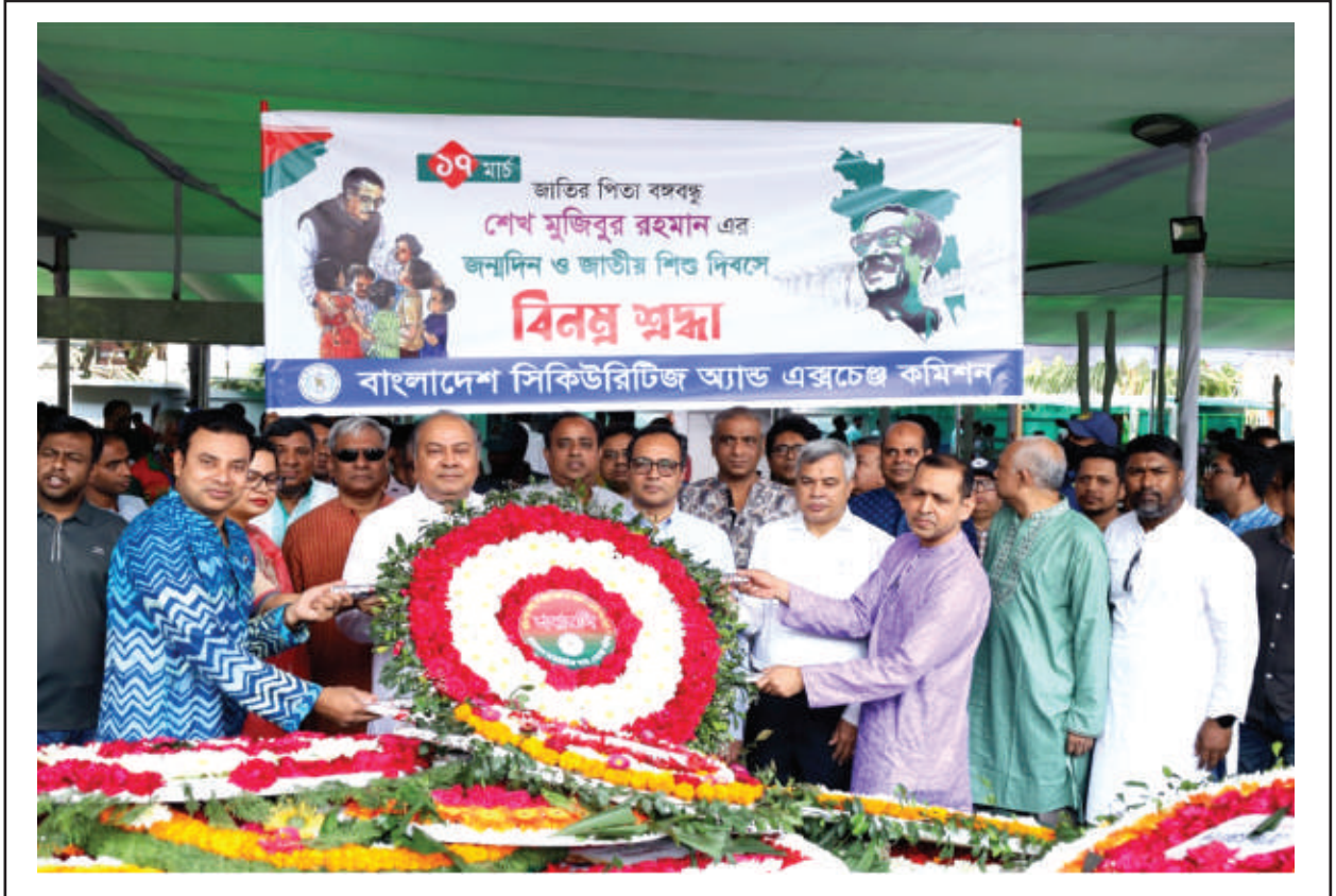
ধানমন্ডি ৩২ নম্বরে জাতির পিতার প্রতিকৃতিতে বিএসইসি'র পুষ্পার্ঘ্য অর্পণ