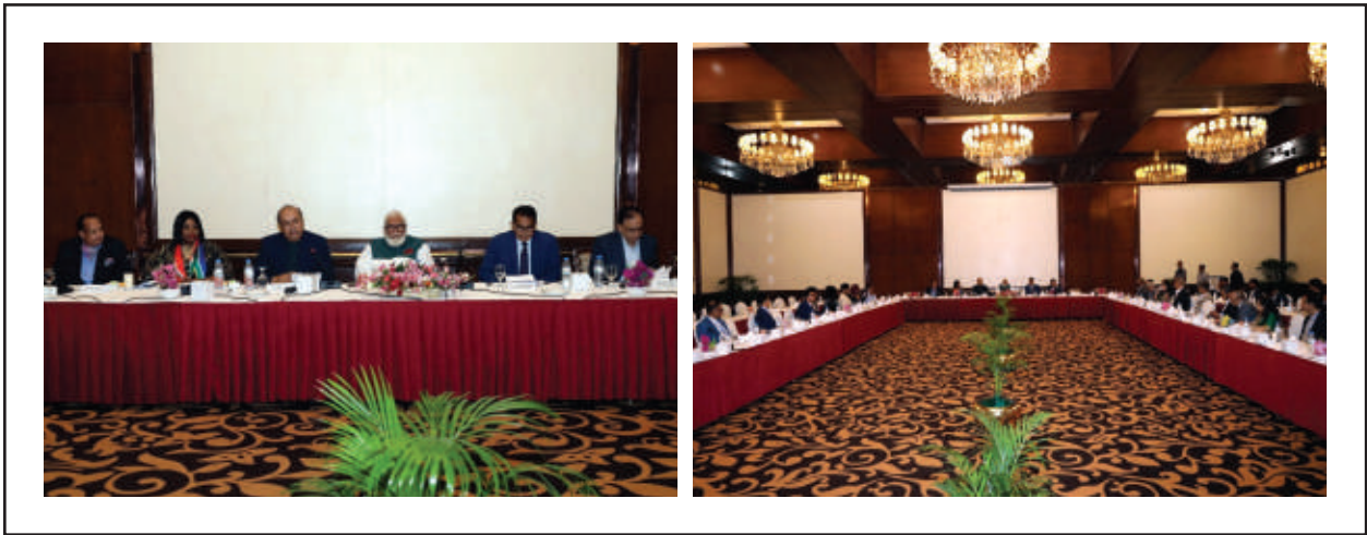
দক্ষিণ আফ্রিকার ব্যবসায়িক প্রতিনিধিদলের সাথে বাংলাদেশের বিভিন্ন খাতে ব্যবসা, বাণিজ্য ও বিনিয়োগের সম্ভাব্যতা ও সুযোগ-সুবিধা প্রভৃতি বিষয়ক আলোচনা-সভা

আলোচ্য সভায় দক্ষিণ আফ্রিকার ব্যবসায়িক প্রতিনিধিদলের সাথে আলোচকবৃন্দের বাংলাদেশের বিভিন্ন খাতে ব্যবসা, বাণিজ্য ও বিনিয়োগের সম্ভাব্যতা ও সুযোগ-সুবিধা প্রভৃতি বিষয়ে মত-বিনিময় হয়। আলোচনাকালে দক্ষিণ আফ্রিকার ব্যবসায়িক প্রতিনিধিদল দক্ষিণ আফ্রিকা ও বাংলাদেশের সাদৃশ্যের উল্লেখ করেন। তাঁরা বাংলাদেশে বিনিয়োগের আগ্রহ ব্যক্ত করেন। সভায় বাংলাদেশের সরকারি-বেসরকারি সংস্থা ও প্রতিষ্ঠানসমূহের শীর্ষ কর্মকর্তাবৃন্দ বাংলাদেশে ব্যবসা ও বিনিয়োগের নানা দিক উত্থাপন এবং এ দেশে বিনিয়োগের আহ্বান জানান। সর্বোপরি, বাংলাদেশে দক্ষিণ আফ্রিকার প্রতিনিধিদলের সন্তোষজনক সফর ও সভার ফলশ্রুতিতে আগামীতে বাংলাদেশের সাথে দক্ষিণ আফ্রিকার বৈদেশিক ব্যবসা-বাণিজ্যের অধিকতর সম্প্রসারণ এবং বৈদেশিক বিনিয়োগ হবে-এরূপ আশাবাদ ব্যক্ত করা হয়।