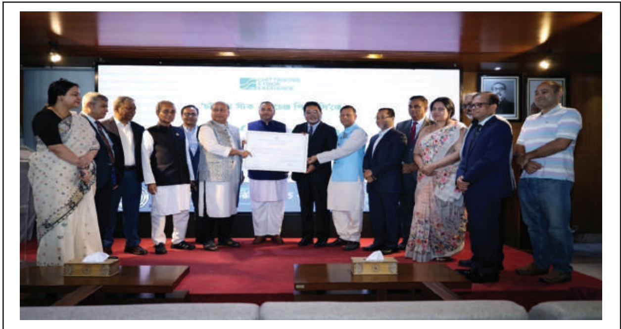
চট্টগ্রাম স্টক এক্সচেঞ্জ পিএলসিকে 'কমোডিটি এক্সচেঞ্জ' -এর সনদ প্রদান করছেন গণপ্রজাতন্ত্রী বাংলাদেশ সরকারের মাননীয় বাণিজ্য প্রতিমন্ত্রী জনাব আহসানুল ইসলাম টিটু, এমপি

স্বাগত বক্তব্যের পর উক্ত অনুষ্ঠানে চট্টগ্রাম স্টক এক্সচেঞ্জ পিএলসিকে 'কমোডিটি এক্সচেঞ্জ'-এর সনদ প্রদান করা হয়। গণপ্রজাতন্ত্রী বাংলাদেশ সরকারের মাননীয় বাণিজ্য প্রতিমন্ত্রী জনাব আহসানুল ইসলাম টিটু, এমপি এই সনদ হস্তান্তর করেন।