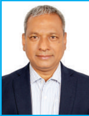
ড. শেখ শামসুদ্দিন আহমেদ কমিশনার