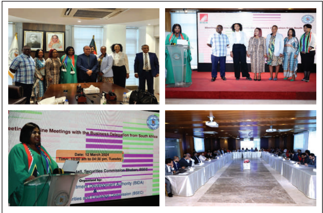
দক্ষিণ আফ্রিকার ব্যবসায়িক প্রতিনিধিদলের সাথে বাংলাদেশের বিভিন্ন সরকারি সংস্থা, গুরুত্বপূর্ণ ব্যবসায় গ্রুপ ও প্রতিষ্ঠানের প্রতিনিধিদের আলোচনা-সভা