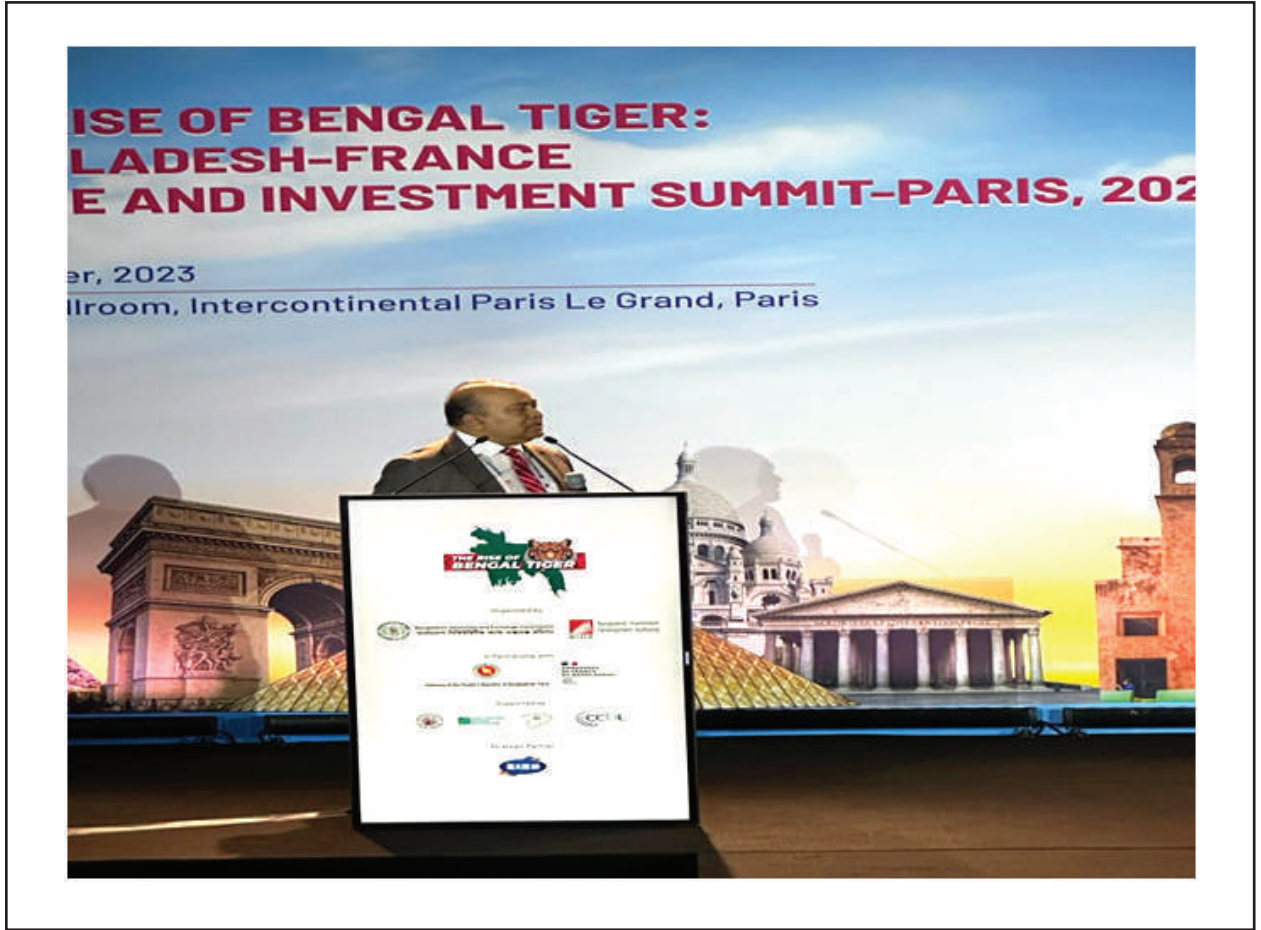
‘The Rise of Bengal Tiger: Bangladesh-France Trade & Investment Summit - Paris 2023’