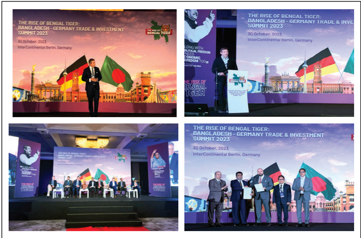
জার্মানির বার্লিনে ‘The Rise of Bengal Tiger: Bangladesh-Germany Trade & Investment Summit 2023’ সামিটে অতিথিবৃন্দ

বার্লিনে এই সফল সামিট আয়োজনের ফলশ্রুতিতে দেশের পুঁজিবাজারে বিদেশি ও প্রবাসী বিনিয়োগকারীদের অংশগ্রহণ বৃদ্ধি এবং বাংলাদেশে বিপুল বৈদেশিক বিনিয়োগ হবে-উপস্থিত বিশেষজ্ঞগণ এমন আশাবাদ ব্যক্ত করেন।