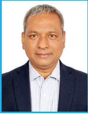
ড. শেখ শামসুদ্দিন আহমেদ কমিশনার