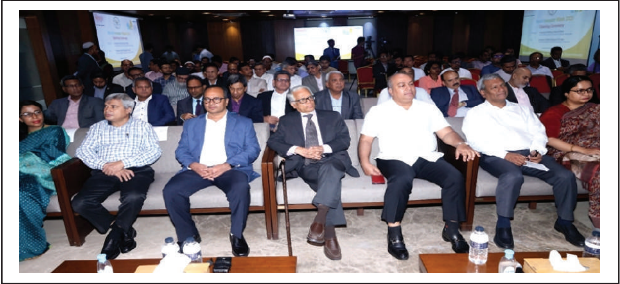
বিশ্ব বিনিয়োগকারী সপ্তাহ ২০২৩ উদ্বোধনী অনুষ্ঠানে অতিথিবৃন্দ

‘বিশ্ব বিনিয়োগকারী সপ্তাহ ২০২৩’ উদ্বোধন উপলক্ষ্যে বাংলাদেশ সিকিউরিটিজ অ্যান্ড এক্সচেঞ্জ কমিশনের আয়োজনে বিশ্ব বিনিয়োগকারী সপ্তাহের উদ্বোধনী অনুষ্ঠান অনুষ্ঠিত হয়। International Organization of Securities Commissions (আইওএসসিও)-এর সদস্য দেশ হিসেবে বাংলাদেশ সিকিউরিটিজ অ্যান্ড এক্সচেঞ্জ কমিশন (বিএসইসি) ২০১৭ সাল থেকে প্রতিবছর ‘বিশ্ব বিনিয়োগকারী সপ্তাহ’ উদ্বোধন করেছে। অনুষ্ঠানটি বিএসইসি’র মাল্টিপারপাস হলে অনুষ্ঠিত হয়।