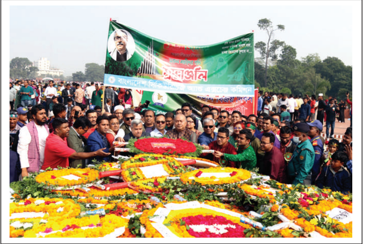
মহান বিজয় দিবস ২০২৩ উপলক্ষ্যে জাতীয় স্মৃতিসৌধে বিএসইসি'র পক্ষ থেকে পুষ্পার্ঘ্য অর্পণ