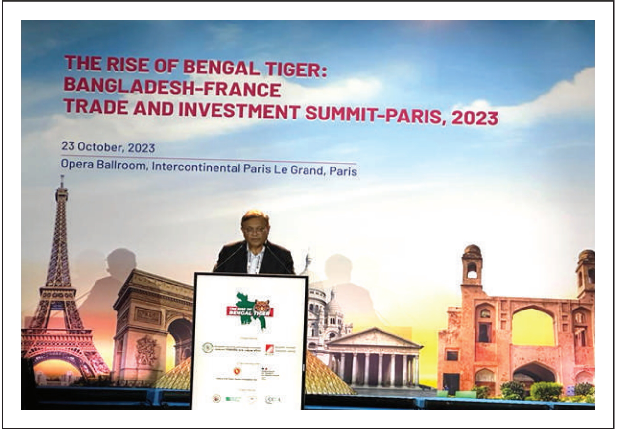
‘The Rise of Bengal Tiger: Bangladesh-France Trade & Investment Summit - Paris 2023’

সামিটে গণপ্রজাতন্ত্রী বাংলাদেশ সরকারের তথ্য ও সম্প্রচার মন্ত্রণালয়ের মাননীয় মন্ত্রী ড. হাছান মাহমুদ, এমপি